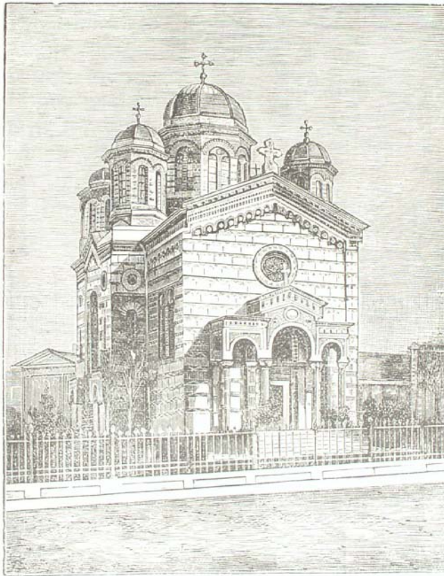
BISERICA DOAMNA BĂLAȘA